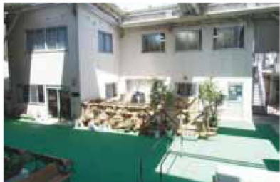
光の差し込むウッドデッキで団欒を