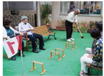
人工芝の専用広場。ゲートボールや様々なレクリエーションを楽しんでいただけます。