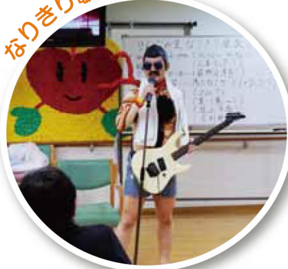
なりきり歌謡ショー